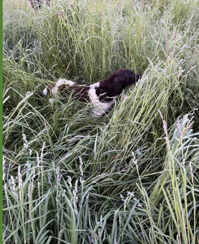
...natürlich sind auch unsere Hunde voll im Einsatz...