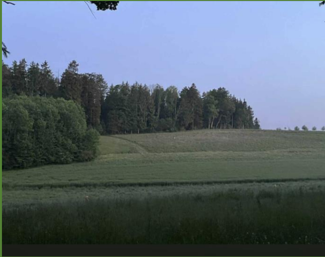
Im Vorder- und Hintergrund zwei grossen wiesen zum Ablaufen